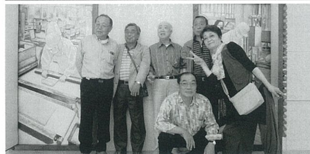
〔編集：徳野喜一郎会員〕